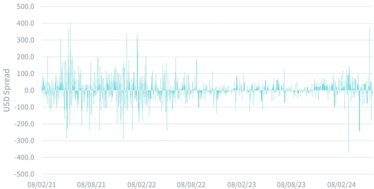
Figura 2: Lo spread tra il contatto front month e i prezzi spot converge

La performance storica non è indicativa di quella futura e qualsiasi investimento può diminuire di valore.