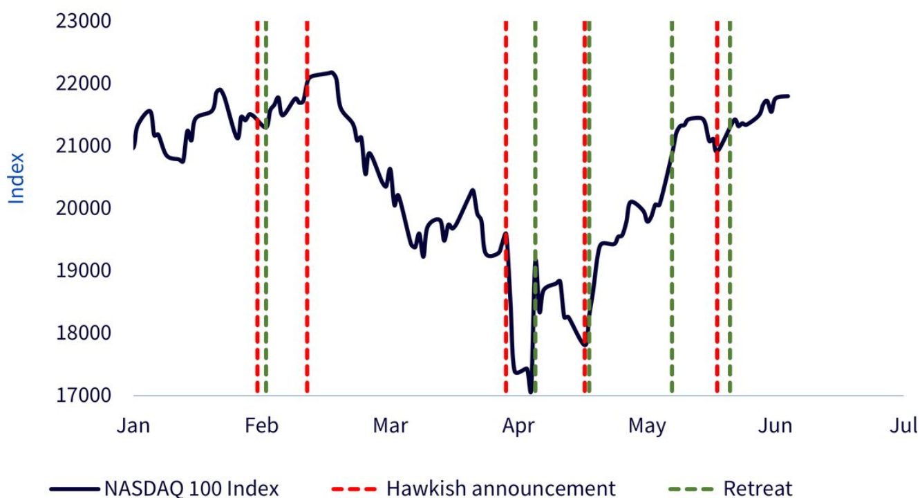
Figura 1: Il NASDAQ 100 Index dimostra che l'effetto TACO è reale

La performance storica non è indicativa di quella futura e qualsiasi investimento può diminuire di valore.