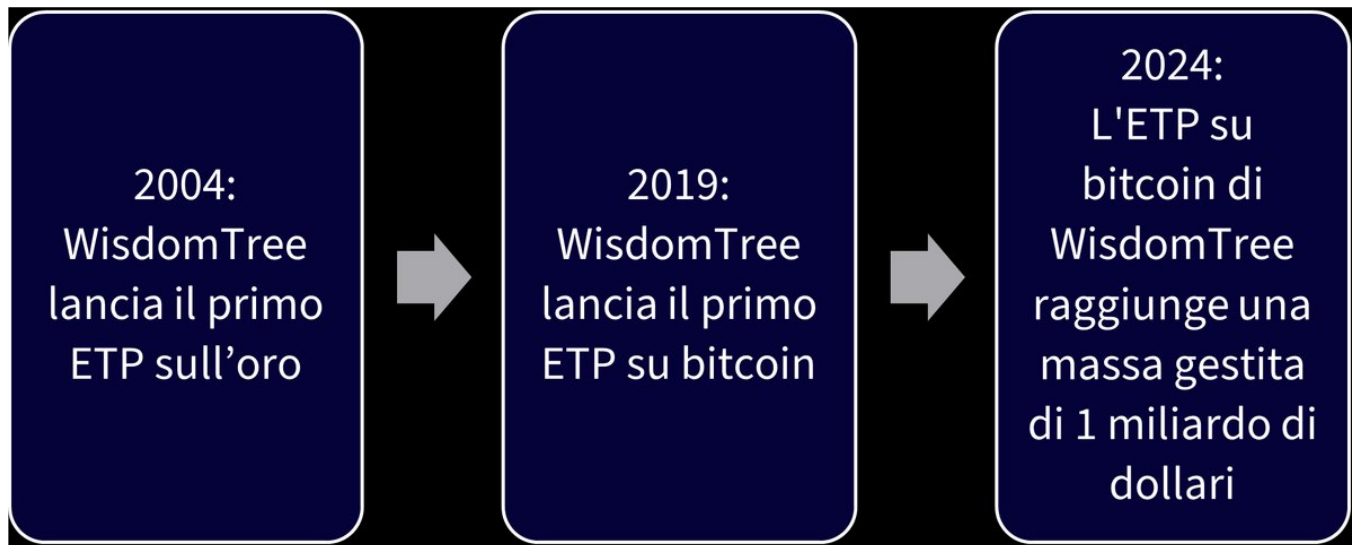
Figura 1: Tappe salienti dell'evoluzione di WisdomTree

La stessa logica si applica ora alle criptovalute. Gli asset digitali, dal bitcoin ai panieri ampi di criptovalute, rappresentano un nuovo modo di trasferire e conservare valore.