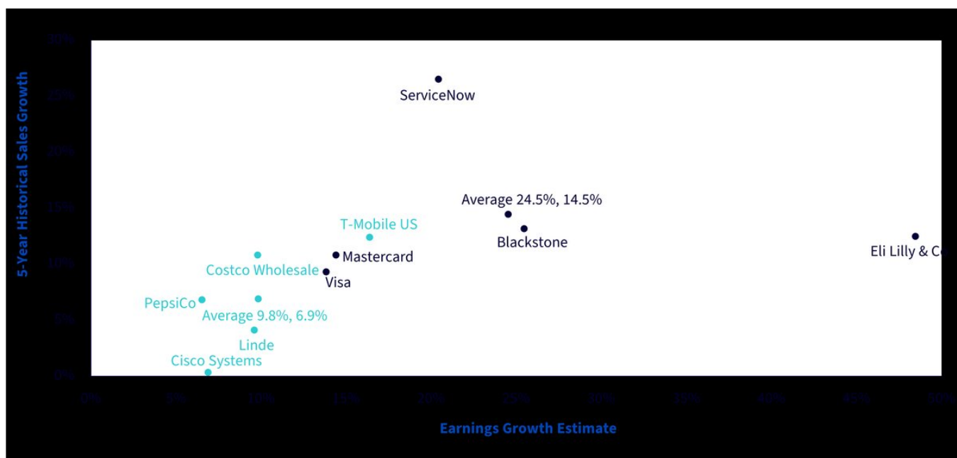
Figura 3: Maggiori titoli unici nel WisdomTree US Quality Growth rispetto ai maggiori titoli unici del NASDAQ 100

Non è possibile investire direttamente in un indice.