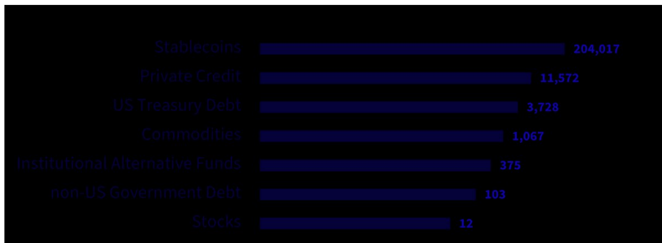
Figura 2: I servizi finanziari stanno migrando verso le blockchain: asset tokenizzati, scala logaritmica, miliardi di USD

Fonte: WisdomTree, RWA.xyz, al 14 gennaio 2024. La performance storica non è indicativa di quella futura e qualsiasi investimento può diminuire di valore.