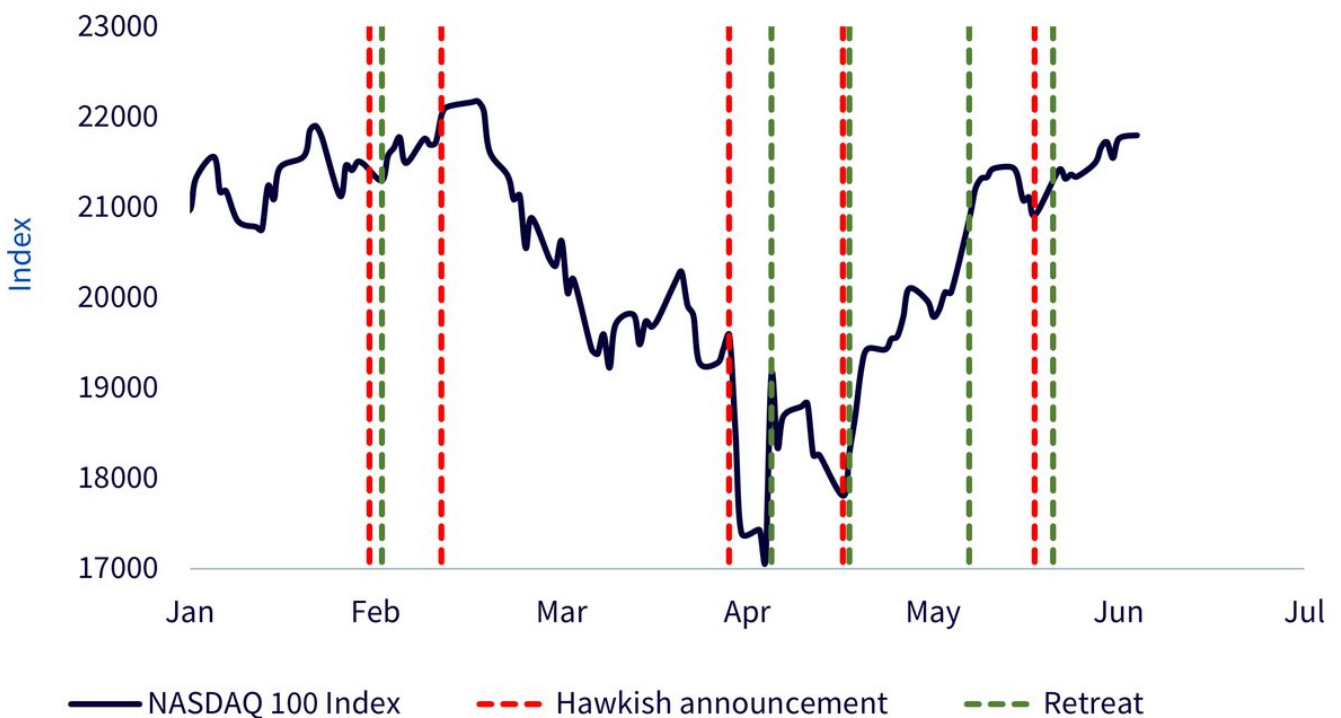
Illustration 1 : L'évolution de l'indice NASDAQ 100 confirme l'existence de la stratégie de trading TACO

Source : WisdomTree, PBS News, ABC News, Bloomberg, au 10 juin 2025. Les performances historiques ne garantissent pas les performances futures, et tout investissement est susceptible de perdre de la valeur.