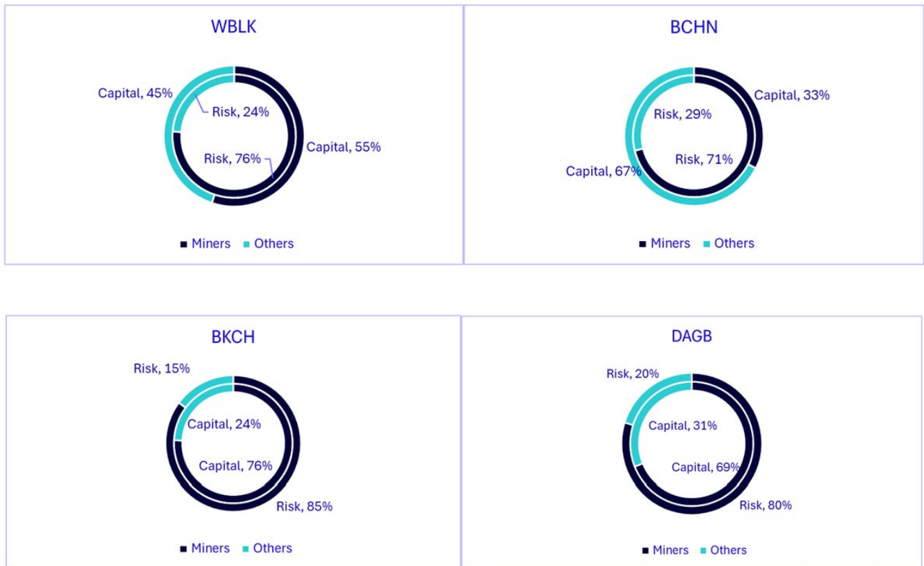
Illustration 2 : allocation du capital (externe) et allocation du risque (interne) aux mineurs d'actifs numériques