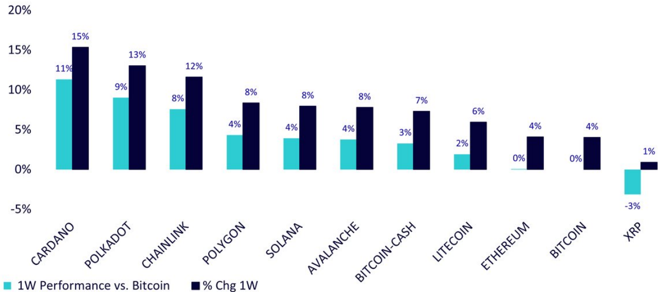
Illustration 1 : Analyse des performances hebdomadaires récentes par rapport au Bitcoin

Les performances historiques ne garantissent pas les performances futures, et tout investissement est susceptible de perdre de la valeur.