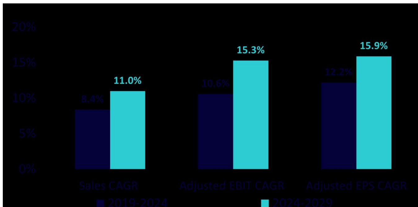
Illustration 2 : Prévisions de croissance du secteur européen de la défense

Les prévisions ne constituent pas un indicateur des performances futures, et tout investissement s'accompagne de risques et d'incertitudes.