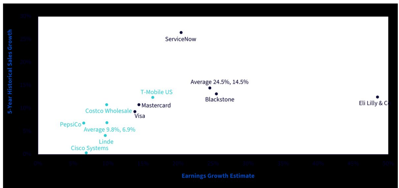
Illustration 3 : Meilleures actions spécifiques de l'indice WisdomTree US Quality Growth par rapport aux actions spécifiques du NASDAQ 100

Source : WisdomTree, FactSet, Bloomberg. Au 31 décembre 2024. Vous ne pouvez pas investir directement dans un indice.