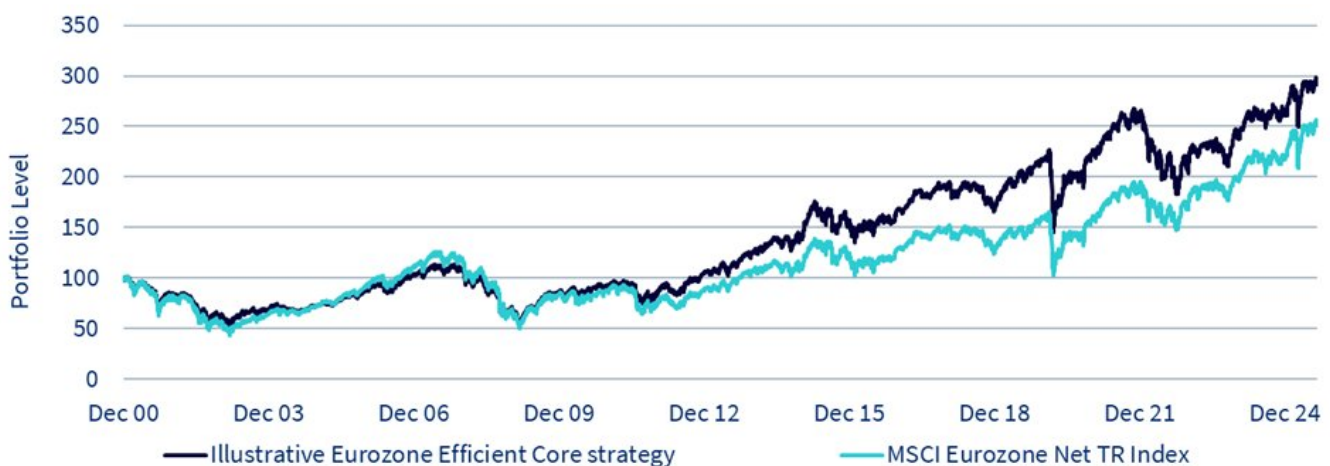
Abbildung 2: Historischer Backtest der WisdomTree Eurozone Efficient Core-Strategie (ohne den ESG-Filter)

Vom 29. Dezember 2000 bis zum 29. August 2025. Tägliche Daten in EUR. Eurozone Efficient Core wird durch die Backtesting-Indexperformance ohne ESG-Filter dargestellt. Es ist nicht möglich, in einen Index zu investieren. Die historische Wertentwicklung ist kein Hinweis auf die künftige Wertentwicklung, und Anlagen können im Wert sinken.