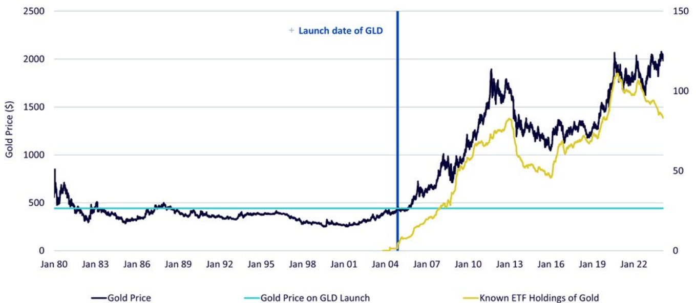
Abbildung 2: Neuer Investmentzugang für Anleger kann einen Angebots-Nachfrage-Schock auslösen

1. Januar 1980 bis 14. Februar 2024. In USD. GLD steht für SPDR Gold Shares und ist das größte börsengehandelte Goldprodukt der Welt. Die historische Wertentwicklung ist kein Hinweis auf die künftige Wertentwicklung, und Anlagen können im Wert sinken.