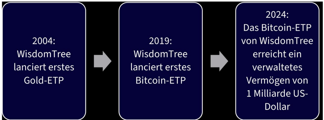
Abbildung 1: Wichtige Meilensteine in der Evolution von WisdomTree

Die gleiche Logik gilt nun auch für Krypto. Digitale Assets, von Bitcoin bis hin zu breiten Krypto-Körben, stellen eine neue Möglichkeit dar, Wert zu übertragen und zu speichern.