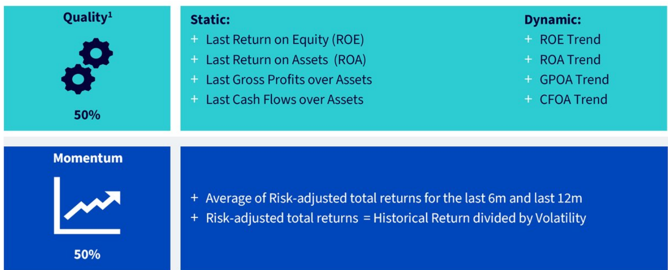
Abbildung 3: Zusammensetzung des WisdomTree Composite Risk Score (CRS)

1. Der Qualitäts-Score ergibt sich aus der gleichgewichteten Summe der acht Scores (pro Aktie sind mindestens sechs Datenpunkte (3 und 3) erforderlich, damit sie berücksichtigt wird). Die Daten werden anhand eines sektorübergreifenden Z-Scores für jede Branchengruppe normiert. Trends werden als historische Z-Scores der letzten zwölf Quartale für jede Branchengruppe berechnet.