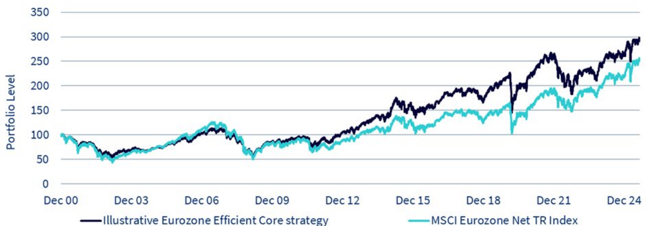
Abbildung 2: Historischer Backtest der WisdomTree Eurozone Efficient Core-Strategie (ohne den ESG-Filter)

Vom 29. Dezember 2000 bis zum 29. August 2025. Tägliche Daten in EUR. Eurozone Efficient Core wird durch die Backtesting-Indexperformance ohne ESG-Filter dargestellt. Es ist nicht möglich, in einen Index zu investieren. Die historische Wertentwicklung ist kein Hinweis auf die künftige Wertentwicklung, und Anlagen können im Wert sinken.