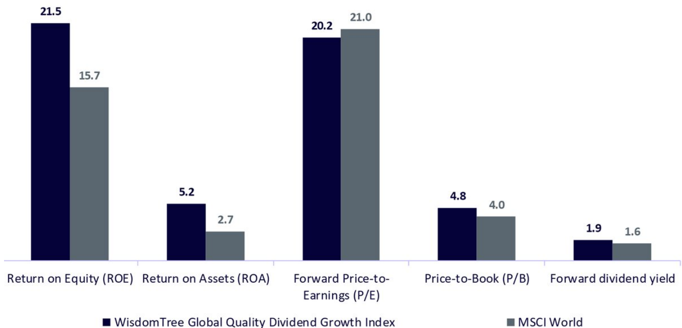
Abbildung 3: Fundamentaldaten der Portfolios

Value: Portfolio der oberen 30 % nach Kurs-Buchwert-Verhältnis. Größe: Portfolio der unteren 30 %. Qualität: Portfolio der oberen 30 %. Geringe Volatilität: Portfolio der unteren 20 %. Hohe Dividende: Portfolio der oberen 30 %. Markt: alle in den USA ansässigen und an der NYSE, AMEX oder NASDAQ notierten CRSP-Unternehmen. Die historische Wertentwicklung ist kein Hinweis auf die künftige Wertentwicklung, und Anlagen können im Wert sinken.