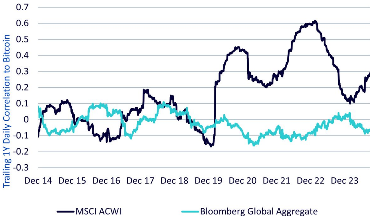
Abbildung 3: Nachlaufende tägliche Korrelationen zu Bitcoin über ein Jahr

Vom 31. Dezember 2014 bis 30. September 2024. Es ist nicht möglich, direkt in einen Index zu investieren. Die historische Wertentwicklung ist kein Hinweis auf die künftige Wertentwicklung, und Anlagen können im Wert sinken.