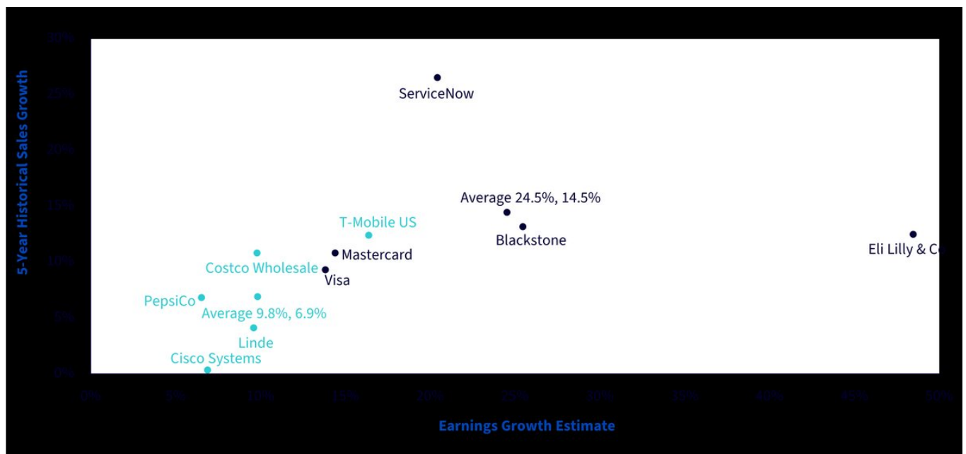
Abbildung 3: Die größten Einzeltitel im WisdomTree US Quality Growth Index vs. die größten Einzeltitel im NASDAQ 100

Stand: 31. Dezember 2024. Es ist nicht möglich, direkt in einen Index zu investieren.