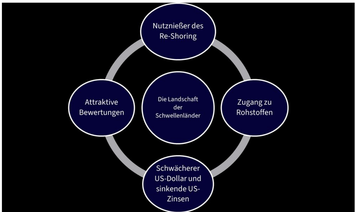
Abbildung 3: Die Landschaft der Schwellenländer

Seit der COVID-19-Pandemie hat die Neugestaltung der Globalisierung – oft als „Re-Shoring“ bezeichnet – die Landschaft des verarbeitenden Gewerbes verändert, wovon auch die Schwellenländer profitieren. Zunehmende geopolitische Spannungen und unterbrochene Lieferketten haben die Unternehmen dazu veranlasst, ihre Lieferketten näher an den eigenen Standort zu verlegen. Aufgrund seiner Nähe zu den USA hat auch Mexiko davon profitiert. Indien war aufgrund seines großen Pools an Menschen im erwerbsfähigen Alter und der niedrigeren Arbeitskosten ein wichtiger Nutznießer dieses langfristigen Trends.