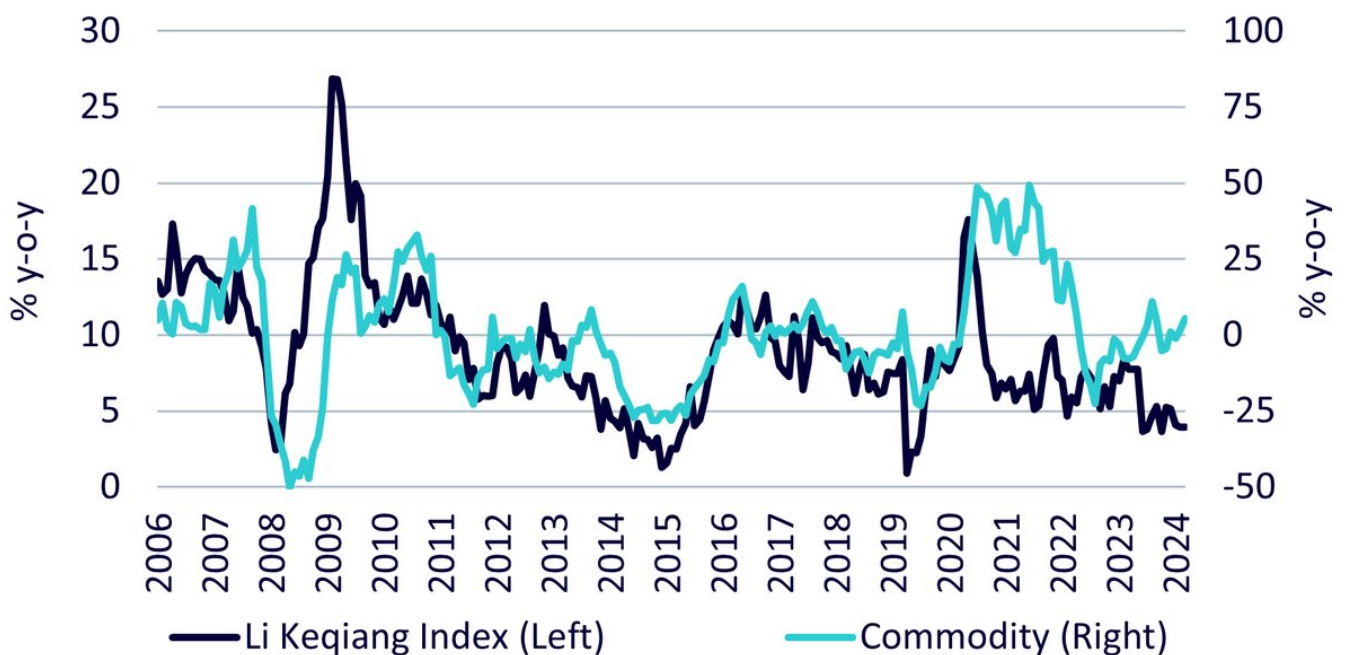
Abbildung 3: Li Keqiang Index und Rohstoffpreise

Von Januar 2005 bis Dezember 2024. Li Keqiang Index: 40 % ausstehende Bank Loans, 40 % Stromerzeugung, 20 % Schienengüterverkehrsaufkommen. Rohstoffe sind durch den Bloomberg Commodity Index Total Return dargestellt. Die historische Wertentwicklung ist kein Hinweis auf die künftige Wertentwicklung, und Anlagen können im Wert sinken.