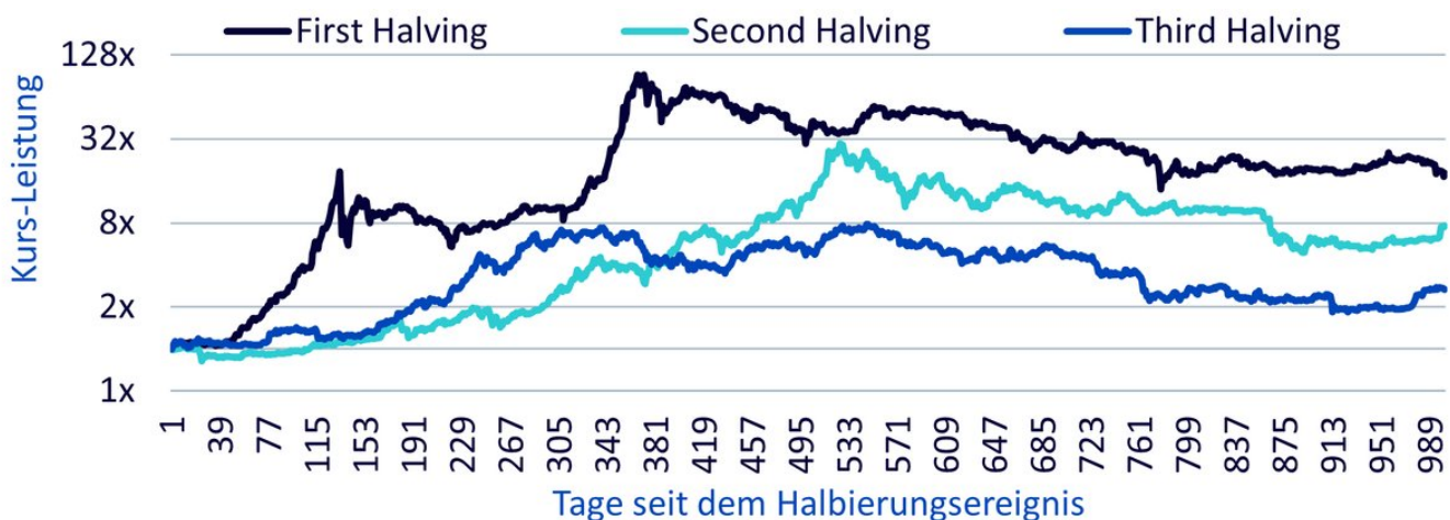
Abbildung 1: Das Kursverhalten von Bitcoin nach den drei vorangegangenen Halbierungszyklen